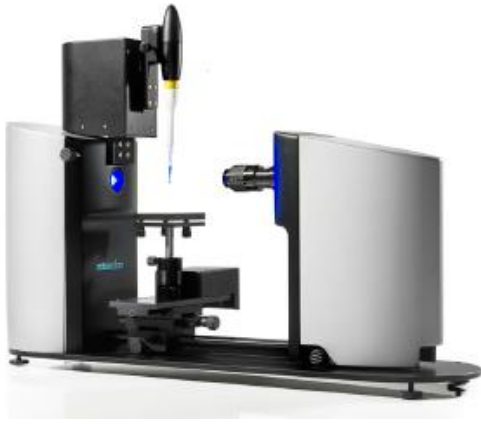
Theta Optik Tensiyometre

İnkjet yazıcıların ıslatabilirlik özelliği tensiyometre ile belirlenebilir. 3-6 Mürekkebin yüzey gerilimi ve substratın serbest yüzey enerjisi substrat ve mürekkep arasındaki tutunma ve ıslanma özelliklerinde önemli parametrelerdir. Baskılar mürekkep damlalarıyla oluşturulduğu için temas açısı ölçümü inkjet yazıcıların kalitesini belirlemede önemli rol oynar. Temas açısının zamanla değişimi ve damlacık boyutları ölçülerek mürekkebin dağılımı ve absorlanması analiz edilebilir.