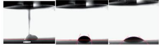
Şekil 3. Yüksek hızlı kamera pikolitre mertebesindeki damlanın yüzeye temas ettikten hemen sonra dağılma ve absorplanmasını görüntüleyebilir.